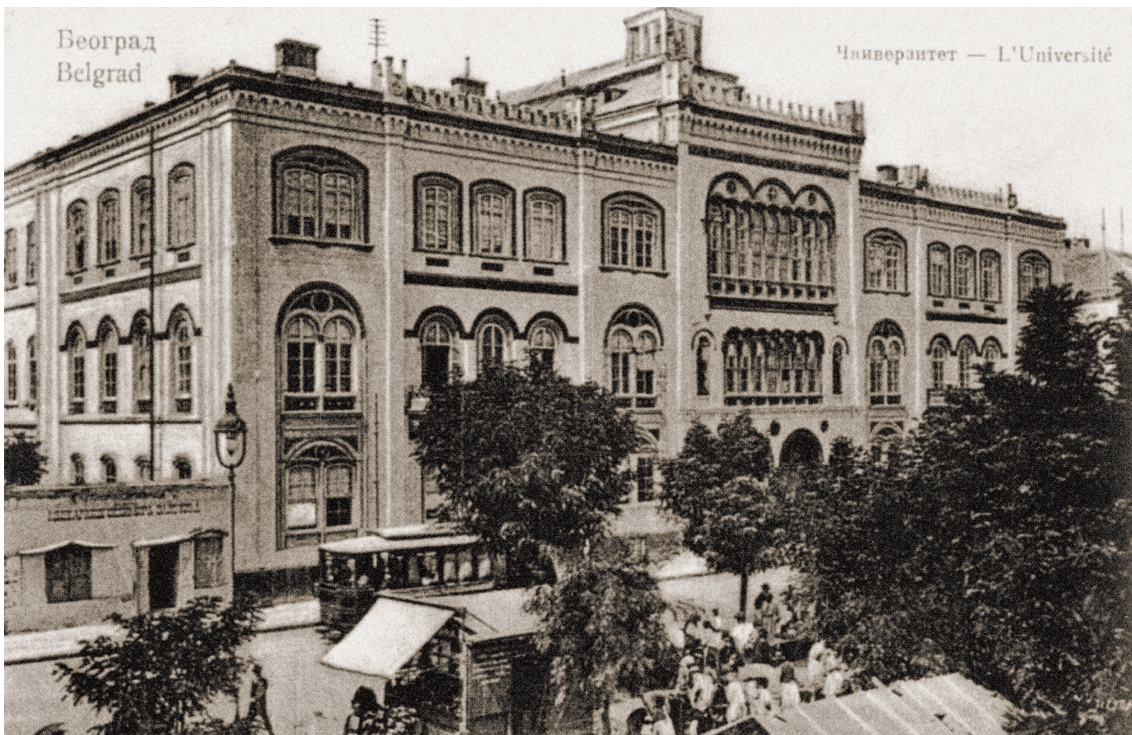
Велика школа (Универзитет у Београду) 1907.