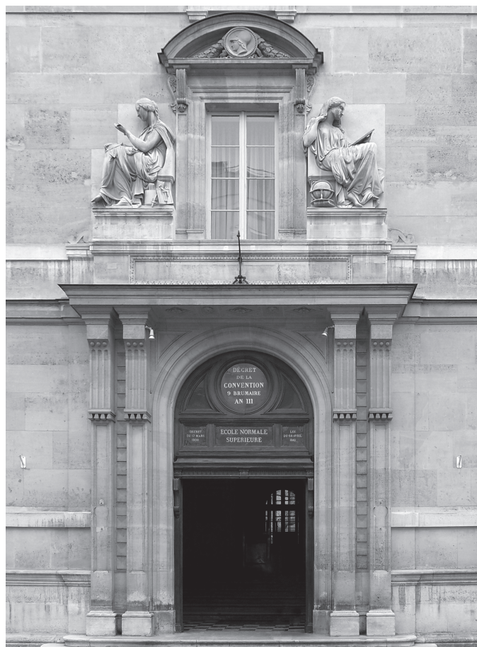
Висока редовна школа (l'École normale supérieure), Париз